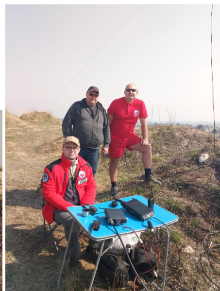
Jedna ze stacji sztabowych LKSR w terenie QTH Loc. KO11FE